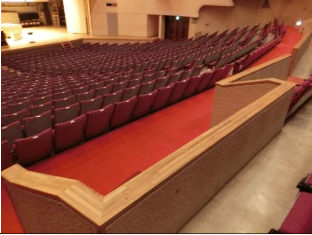
ホールに車いす席がある。