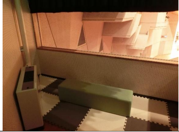
ホールに親子室がある。 (2カ所、個室)