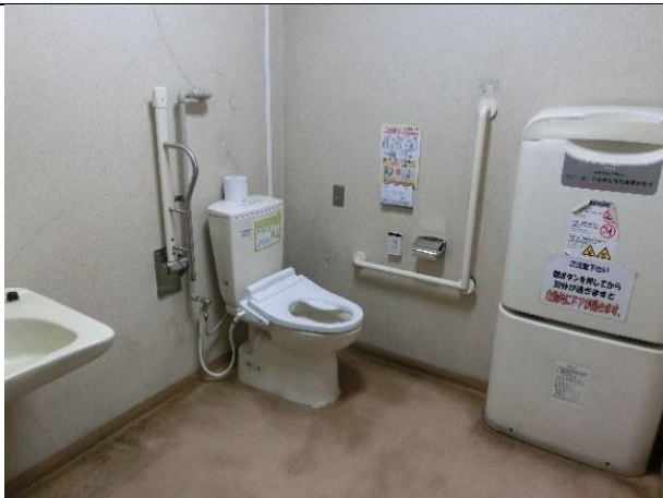
バリアフリートイレには、前広便座、おむつ交換台がある。