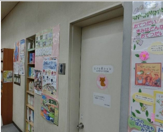
子ども用トイレがある（2階）。