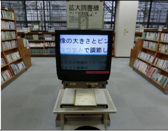
拡大読書機が設置されている（2階）。