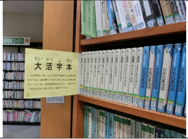
大活字本コーナーが設置されている（2階）。