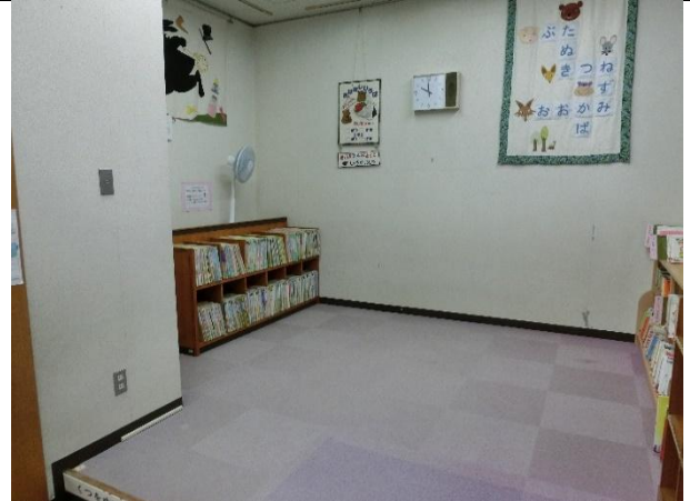
子どもが自由に読書をすることができるカーペットコーナーがある（2階）。