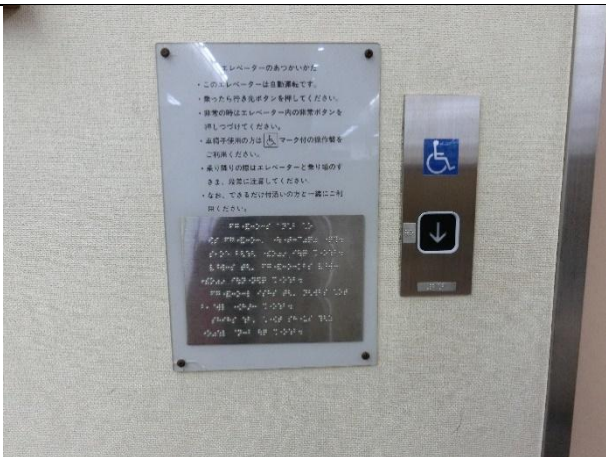
各所に点字案内がある。