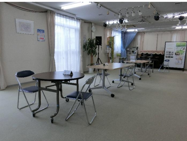
イベント等も開催される1Fサロンはフラットなフロアになっている。