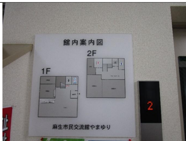
館内案内図がある。