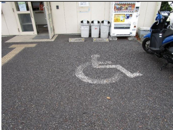
障害者用駐車場が1台がある。