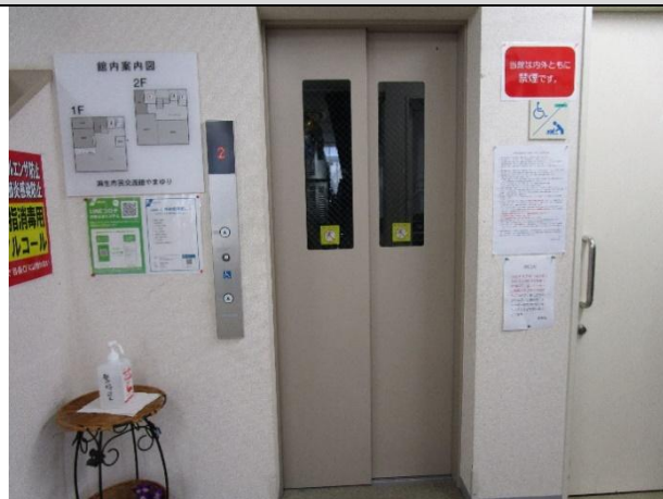
建物内にエレベーターがある。